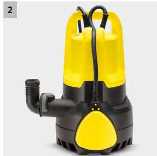
2 Interruptor de flotador