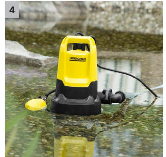
4 Diseñada para el agua sucia