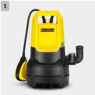
1 Cierre de anillo deslizante de cerámica