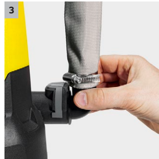
3 Conexión rápida