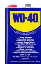
WD-40® GALÓN (1 Galón,