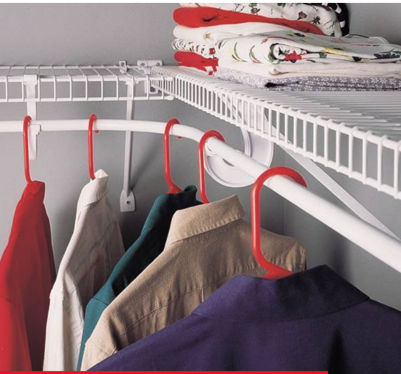
Imágen con fin ilustrativo