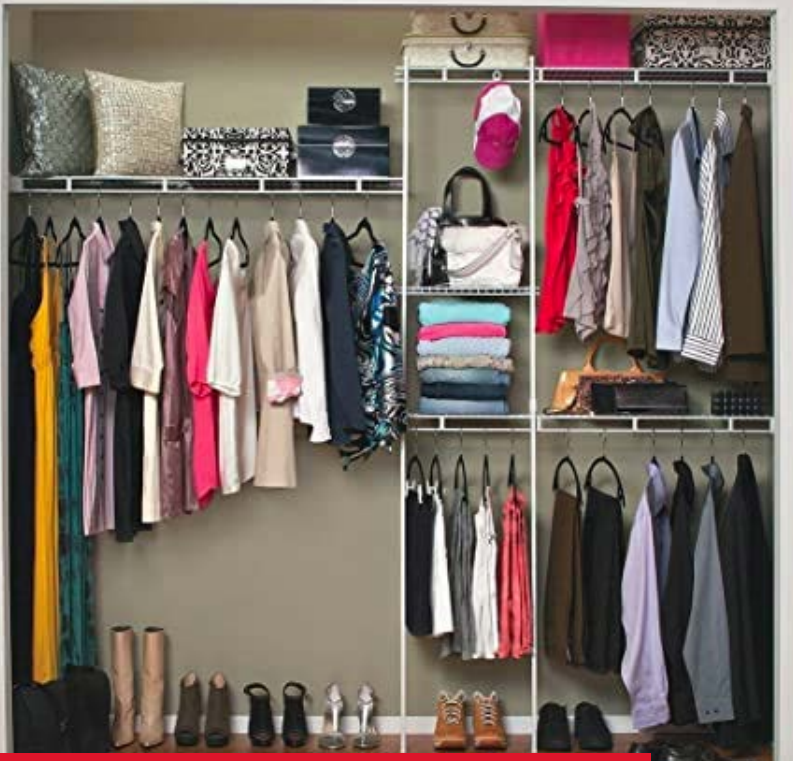
Imágen con fin ilustrativo